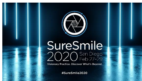
Abb. 2: Das jährliche Treffen von SureSmile-Anwendern ist ein guter Indikator für neue Trends bei digitalen Behandlungskonzepten in der Kieferorthopädie.